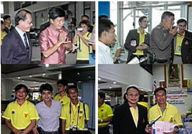
ความถี่สแตนด์บาย:

ภาคราชการ รับ 142.425 MHz. ส่ง 147.425 MHz.